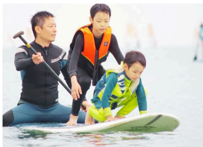
親子サップレース