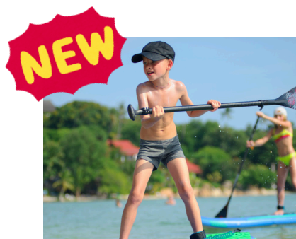
キッズサップレース